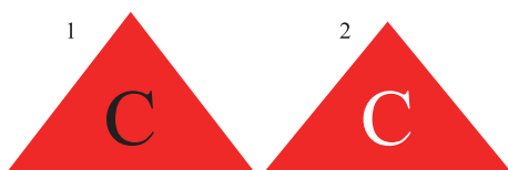
图 2 细胞毒性废物容器标签

在接收过程将细胞毒性废物与一般废物和医疗废物分开,接收的容器内应有适当颜色区分,清楚显示“CD”字样 [13] (如图 2 所示,可选)。